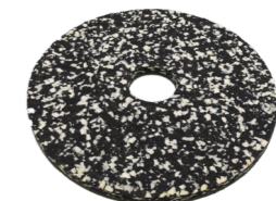
Power Pad Art.-Nr. 201.076