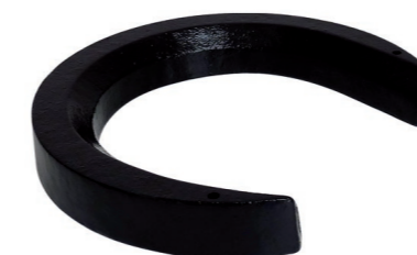
Zusatzgewicht 14 kg. Art.-Nr. 201.068