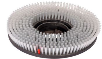
Schrubbbürste Art.-Nr. 205.121