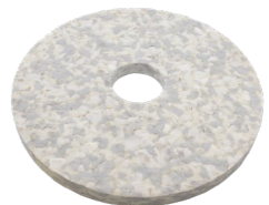
Duo Pad Art.-Nr. 201.077