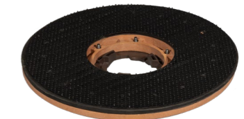
Pad-Treibteller Art.-Nr. 205.122