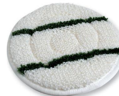
Queen Bonnet Pad, erzielt auf Teppich und Teppichböden beste Reinigungsergebnisse. Art.-Nr. 201.009