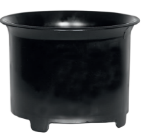
Serienmäßig: Zykloneinsatz Art.-Nr. 109.057