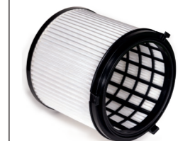
Serienmäßig: Filterpatrone, HEPA13 Art.-Nr. 109.058